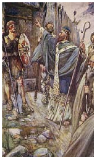
São Columba e os Pictos