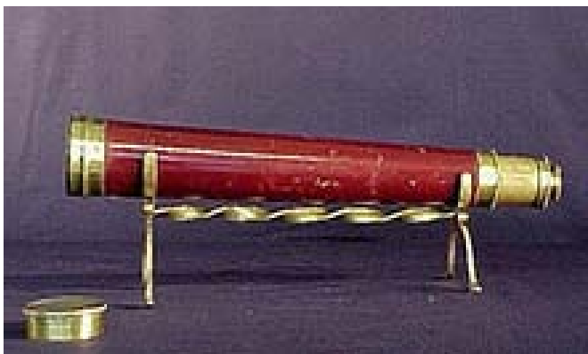
Fig. 2 Luneta Astronômica.

No século XVI, cientistas faziam observações astronômicas a olho nu ou com equipamentos pouco eficientes. No início do século XVII, Hans Lippershey (1570-1619) inventou a luneta, instrumento óptico que utilizava uma lente côncava e uma convexa, que recebeu o nome de refrator. Em 1609, Galileu Galilei construiu sua própria luneta e a utilizou para observar o céu, assim nasceu a luneta astronômica, equipamento que revolucionou a astronomia.